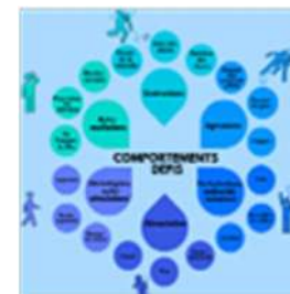
SCHÉMA DES SOLIDARITES 2023 2028