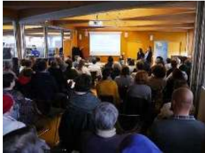
JMA à Belleville

L'édition 2023 s'est bien déroulée, malgré de mauvaises conditions météorologiques durant l'après-midi.