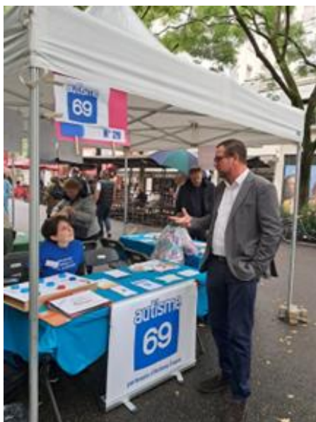
Le maire de Villeurbanne.