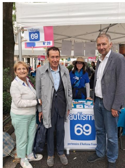
Le président de la Métropole

Plus de la moitié des visiteurs sont des parents ou proches de personnes concernées.